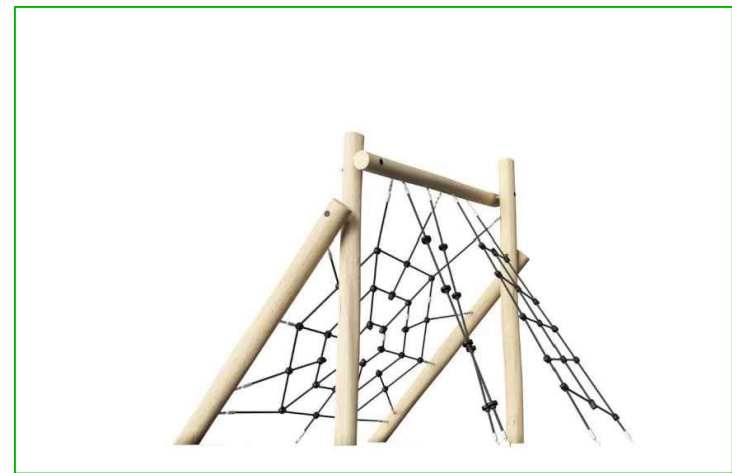
9) NR0813 Robinia obstacle Op en over klimnet M