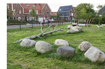
8) ZWERFKEIEN TBV STEENCIRKEL