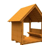
9) SPEELHUISJE EIFEL