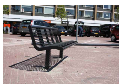
14) ZITBANK TAMARA