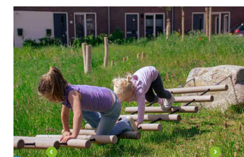
5) SPIDERSTONE WIEBELBRUG