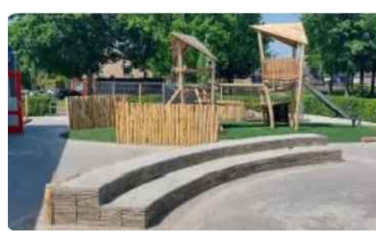
1) VOETBALVELDJE HERGEBRUIKTE BETONGEGELS