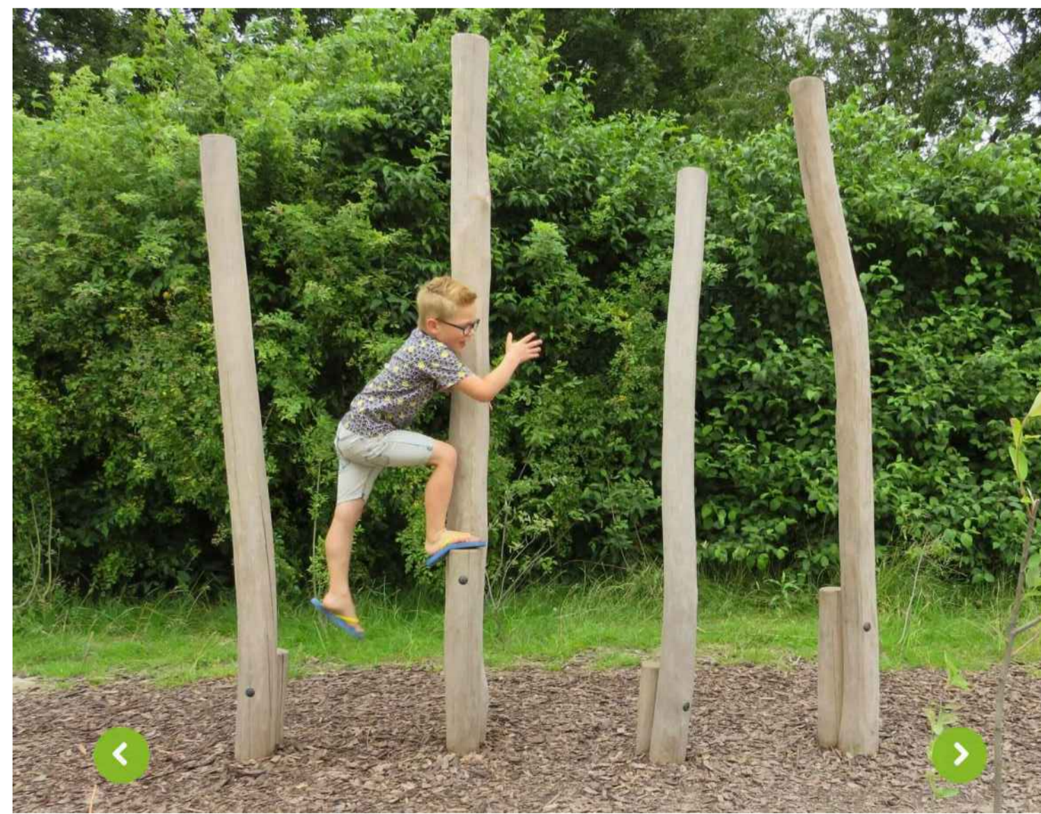
1) KLEIN STELTENPAD ROBINIA