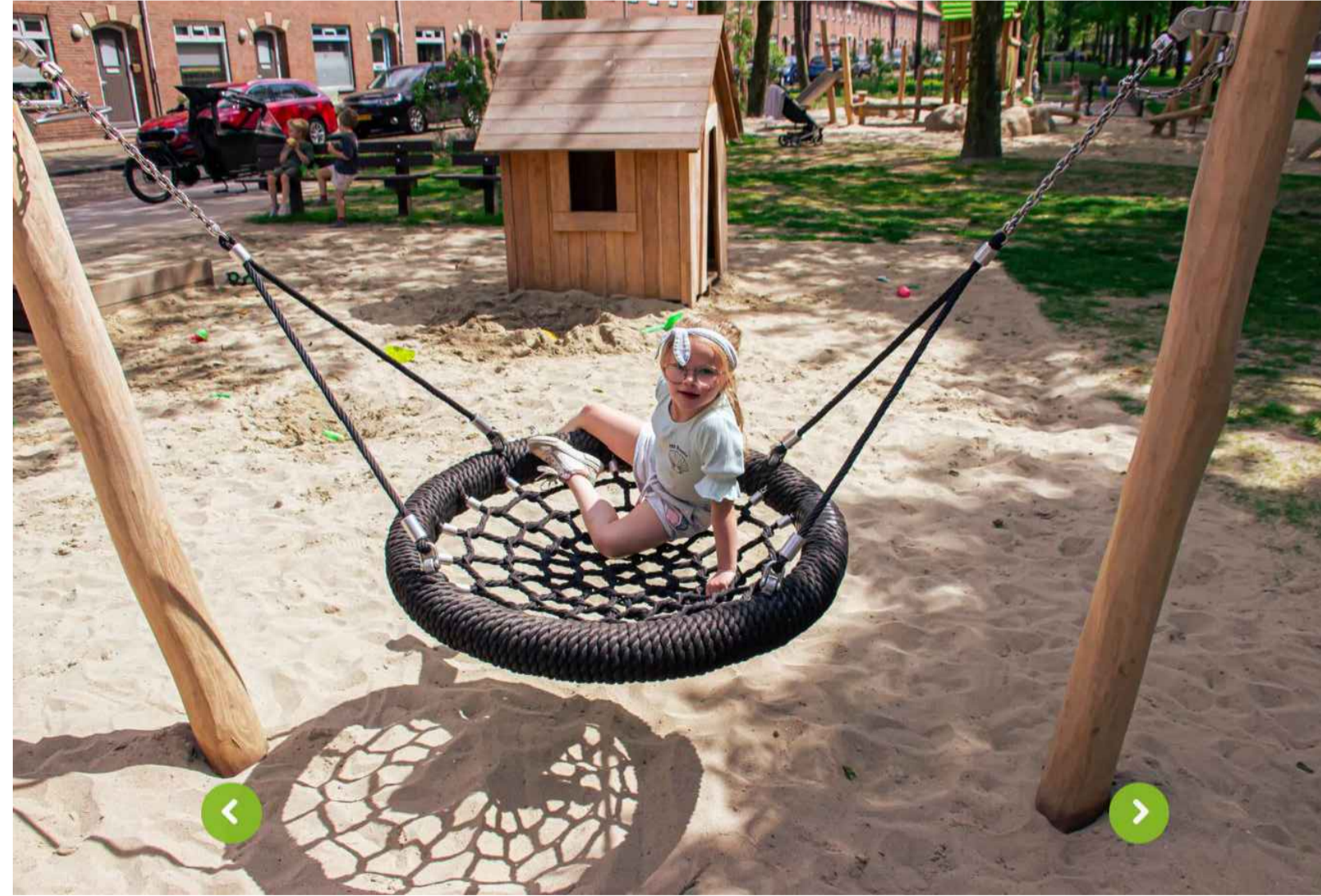
2) PEUTER VOGELNESTSCHOMMEL